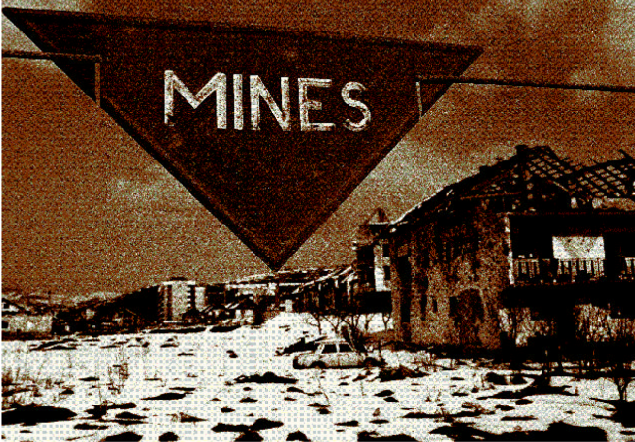
Destrucción causada por los combates en Ilidza, Sarajevo. El gran número de minas terrestres representó una gran amenaza para las personas que regresaron a sus hogares después de la guerra.

ración Tormenta», una masiva ofensiva militar en la que participaron más de 100.000 soldados y en la que invadió todas las zonas controladas por los serbios en el oeste y el sur de la región croata de Krajina. En consecuencia, unos 200.000 civiles serbios huyeron, en su mayoría a la República Federativa de Yugoslavia, en tanto que otros, en número menor, se quedaron en las zonas de Bosnia y Herzegovina controladas por los serbios. El 28 de agosto de 1995, las fuerzas serbobosnias dispararon un obús contra un concurrido mercado de Sarajevo, matando a 37 personas y causando heridas a varias decenas. La OTAN respondió emprendiendo durante dos semanas una campaña aérea intensiva contra objetivos serbobosnios. Reforzadas por los ataques aéreos, las fuerzas gubernamentales croatas y bosnias lanzaron una ofensiva conjunta en Bosnia y Herzegovina para reconquistar territorio en poder de los serbios, recuperando un tercio del territorio que estaba en poder de las fuerzas serbobosnias. Conscientes de que perdían territorio día a día, las autoridades serbias de Bosnia aceptaron un alto el fuego y accedieron a asistir a unas conversaciones de paz en Dayton, Ohio (Estados Unidos).