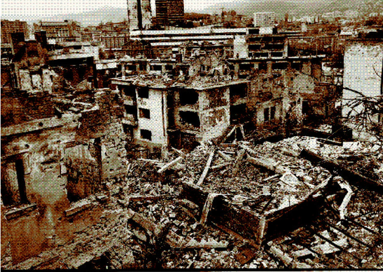
El implacable bombardeo de Sarajevo durante la guerra de Bosnia causó una destrucción generalizada.

En las primeras fases de la guerra, los musulmanes y los croatas de Bosnia y Herzegovina lucharon juntos contra los serbios de Bosnia, pero a principios de 1993 estallaron los combates entre los croatas bosnios y los musulmanes bosnios. Se inició otra oleada de «limpieza étnica», esta vez en la región central de Bosnia. Las fuerzas croatas de Bosnia, respaldadas por Croacia, intentaron crear una franja de territorio étnicamente puro limítrofe con Croacia. Aunque las tensiones entre ellas continuaron, los combates entre las fuerzas croatas de Bosnia y las fuerzas gubernamentales bosnias, integradas principalmente por musulmanes, tocaron a su fin en marzo de 1994, con la firma del Acuerdo de Washington y la creación de una Federación Croato-Musulmana.