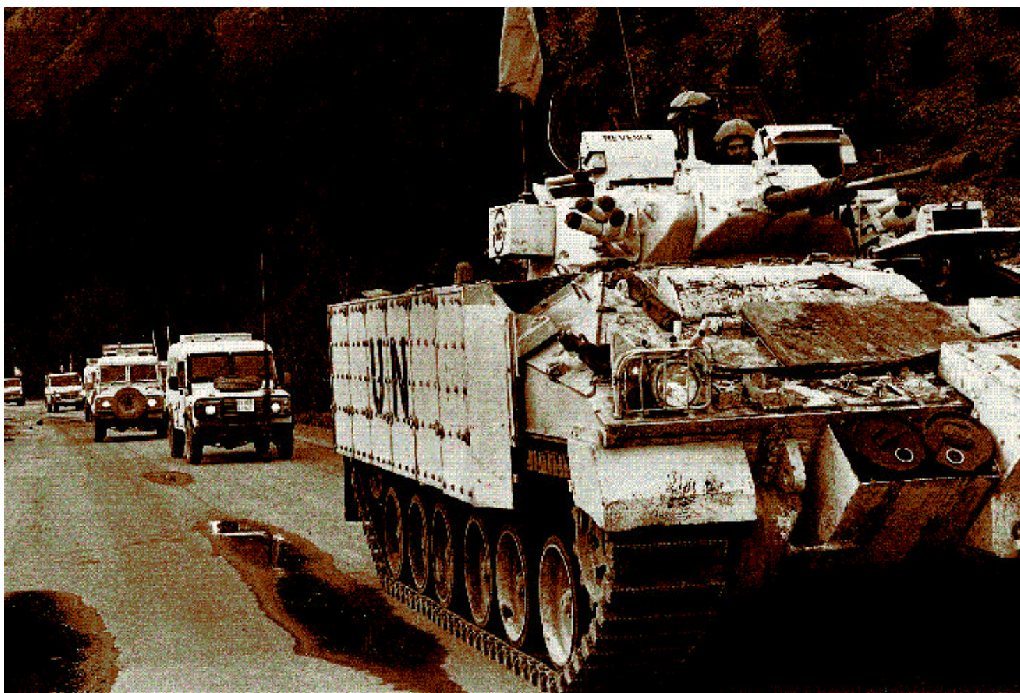
Un convoy del ACNUR, escoltado por tropas de la UNPROFOR, se dirige de Zepce a Zavidovici, en el centro de Bosnia.

Otra decisión difícil que el ACNUR hubo de tomar fue si ayudar o no a evacuar a los civiles vulnerables. Al principio, el ACNUR se resistió a evacuar a los civiles, pero cuando fue evidente que la alternativa para muchos de ellos eran los campos de detención donde en muchos casos eran golpeados, violados, torturados o se les quitaba la vida, la organización comenzó a evacuar a los civiles cuyas vidas corrían peligro. Tales evacuaciones, sin embargo, provocaron un aluvión de críticas por entenderse que el ACNUR facilitaba la «limpieza étnica». En noviembre de 1992, la Alta Comisionada Ogata describió así la situación: